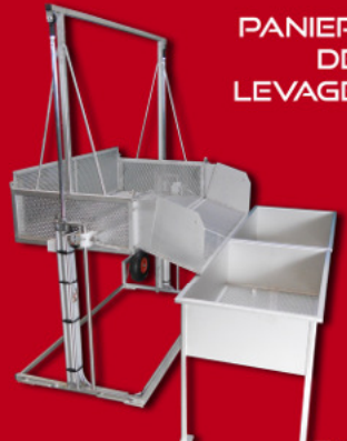
PANIER DE LEVAGE