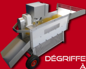
DÉGRIFFEUSE À VIS