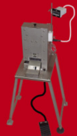
POSTE DE VACCINATION ET DE DEBECQUAGE