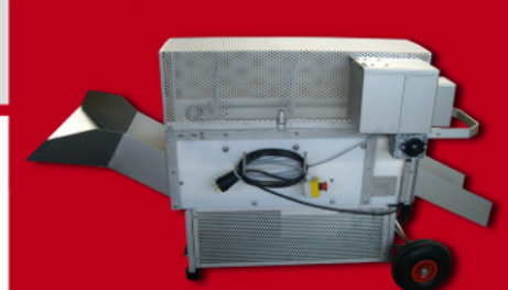
DÉGRIFFEUSE À PALES