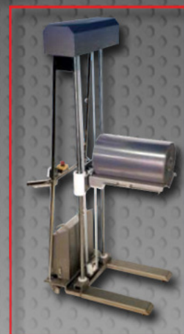
VERSION LE (linéaire électrique)